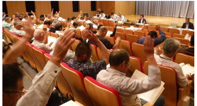
▲阿賀野市多面的広域協定運営委員会総会の様子

令和元年7月から阿賀野川土地改良区事務所2階に「多面的機能支払推進室」を設置し、事務局長・事務局2名体制で活動組織の活動内容や作業記録、会計処理等について確認を行い、適切に事務処理を進めています。