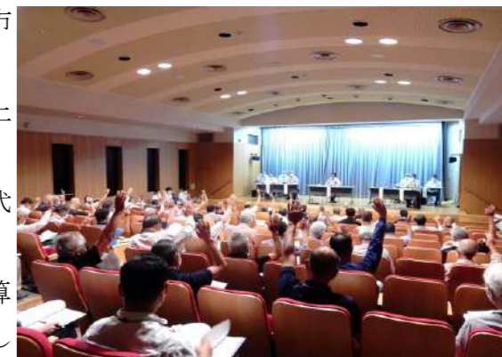
▲運営委員会通常総会の様子

議件内容としては決算のほか事業計画及び活動計画、予算等について慎重審議され、また、活発な議論、質疑を交わし慎重審議した結果、全議案原案どおり議決されました。