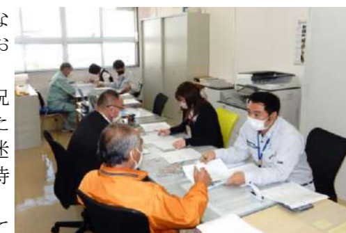
▲二班体制による面談の様子

増員体制のもと、引き続き活動組織の皆様を精一杯支援させていただきますので、今後ともよろしくご依頼申し上げます。